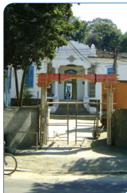
A revitalização do espaço em frente ao INPAR é uma das iniciativas para melhor atender as crianças e os adolescentes do instituto

No espaço revitalizado, será inaugurada, no dia 7 de setembro, a praça Rev. John Knox, em homenagem ao patriarca do presbiterianismo. Com o apoio dos sínodos do Rio de Janeiro e da Guanabara, o empreendimento receberá um memorial – conjunto escultórico – pelos 450 anos do presbiterianismo no mundo. A iniciativa, que não irá impactar o orçamento do instituto, é coordenada pelo reverendo Guilhermino Cunha. Por iniciativa do INPAR, a Prefeitura do Rio de Janeiro vai revitalizar a Praça Reverendo Álvaro Reis – um tributo ao primeiro moderador da Assembleia Geral da Igreja Presbiteriana do Brasil –, no bairro do Estácio, Zona Norte do Rio.